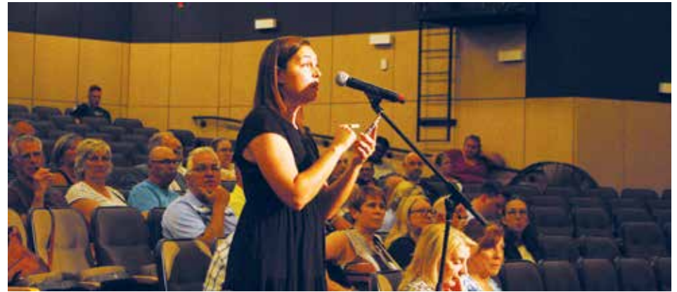
Resident expressing to the council on June 9 how unacceptable the living conditions on her road are, due to the cloud of dust coming off the unpaved Montée Dalton Road (JO)