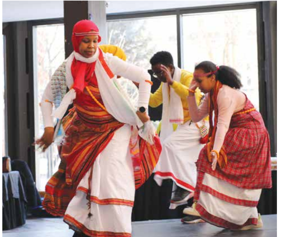
Spectacle de danse africaine traditionnelle lors de la Foire Afro-Excellence 2025. / Performers showcasing traditional dances during the 2025 Afro-Excellence fair (SD).