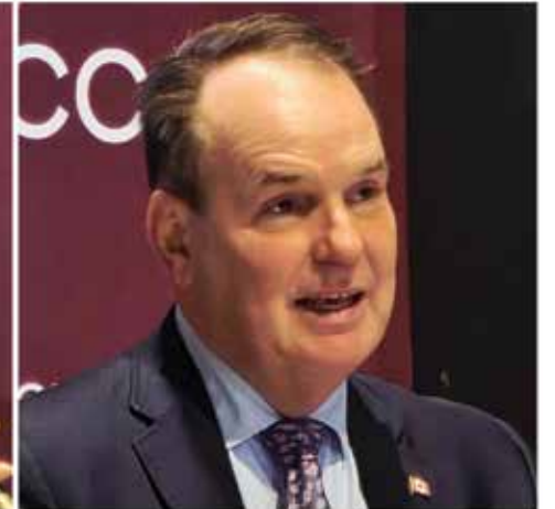
National Defence Minister David McGuinty, Mayor Maude Marquis-Bissonnette and Transport Minister Steven MacKinnon addressed business leaders at a Gatineau Chamber of Commerce breakfast on April 16, outlining federal investment in cybersecurity and defence and proposing new initiatives to position the region as a hub for the defence sector. (TF)