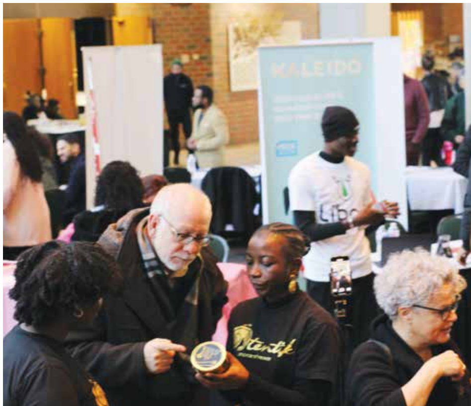
Visiteurs de la Foire Afro-Excellence 2025. / Event goers enjoying the 2025 edition of the fair (SD).