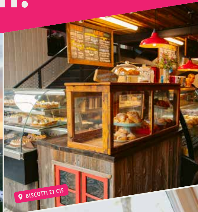
📍 BISCOTTI ET CIE