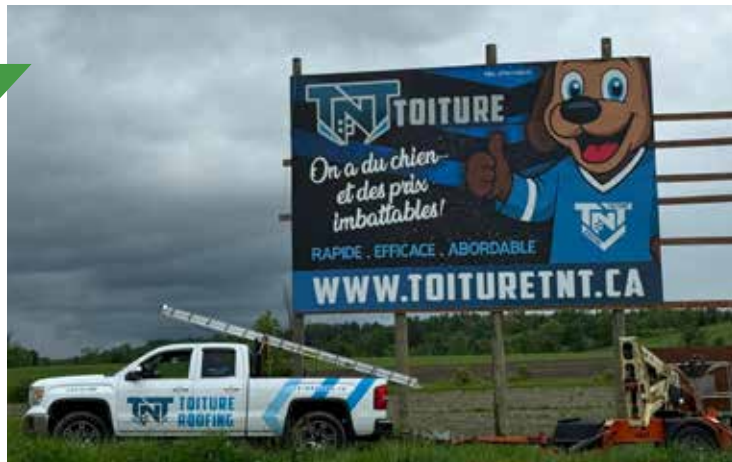
Panneau publicitaire de Toiture TNT installé en bordure de l'autoroute 50 (4 décembre 2025).

Le 4 décembre dernier, les propriétaires ayant des pancartes installées du côté nord de l'autoroute 50 ont