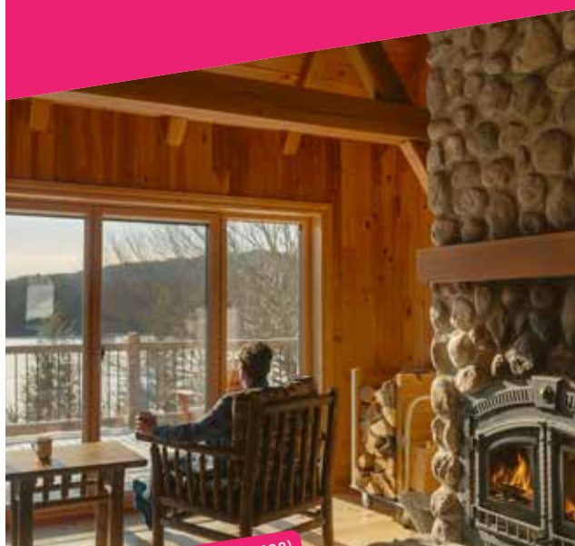
📍 KENAIK NATURE (Entr. 850188)