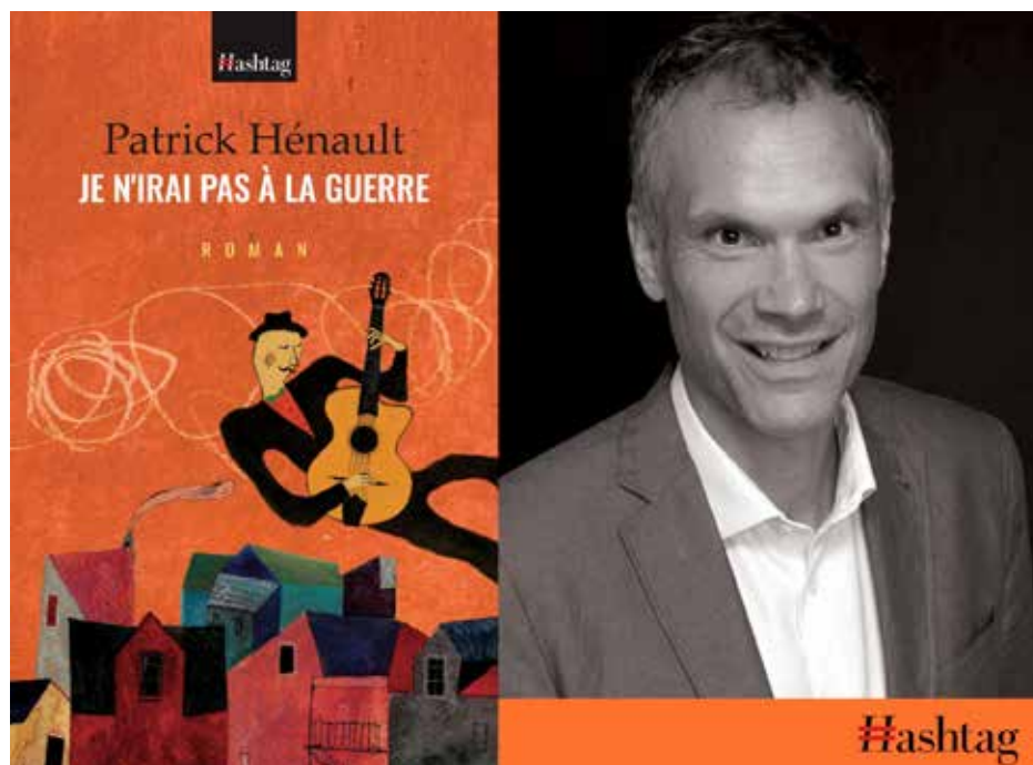
Roman : Je n'irai pas à la guerre (10 décembre 2025). MG PHOTO : GRACIEUSE TÉ DE PATRICK HÉNAULT

Pour ceux et celles qui aimeraient se procurer le roman, celui-ci est disponible en librairie ainsi qu'en ligne aux Éditions Hashtag.