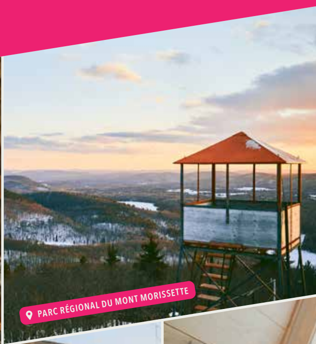
📍 PARC RÉGIONAL DU MONT MORISSETTE