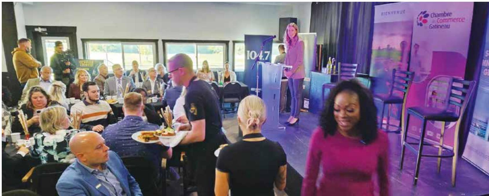
At the mayor's breakfast, Maude Marquis-Bissonnette outlined her vision for Gatineau's economic future, focusing on diversification, public-private collaboration, and revitalizing the downtown core, followed by a panel discussion with local business leaders. (TF) PHOTO: TASHI FARMILLO